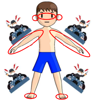
図1_感覚過敏のイメージ

❑ 深層筋を鍛えると、触覚由来の刺激を表層筋と深層筋とが協力しながら処理していく（図4の状態から図3の状態にしていく）ことが上手になります。こういう理由で本来脳に原因のある触覚過敏に、筋肉の面から改善を試みることができるとされます。