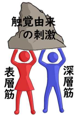
図3_通常の表層筋と深層筋の関係