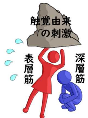
図4_制御不能の表層筋